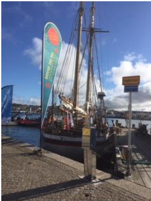
Båten R/S Astrid Finne