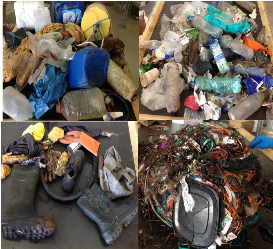
Figur 6 Bilder från plockanalys av det insamlade skräpet.

Inga HSR-påsar påträffats i de strandskräpsmätningar som genomfördes i områden närheten av holkarna.