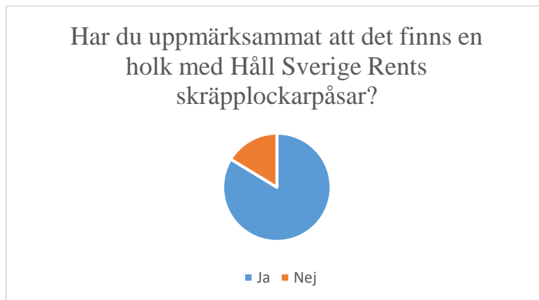
Figur 2 84 % uppmärksammande holkarna på plats.

Totalt uppskattas att över 300 påsar och säckar användes av besökare, varav ca 200 påsar (25 l) och ca 130 (150 l) säckar. Resultatet från enkätundersökningen visade att 84 % av pilotområdes besökare hade uppmärksammat holkarna 3 . 17 % av de av dessa hade även tagit påsar från holken och använt antingen som egen skräppåse eller för skräpplockning på plats. Holkarna var uppskattade och över 90 % ansågs att det är ett bra initiativ för att minska nedskräpning.