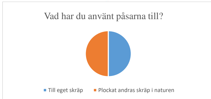
Figur 4 Hälften av de som använt Håll Sverige Rent påsarna har plockat strandskräp medan andra hälften använt dem till eget skräp.